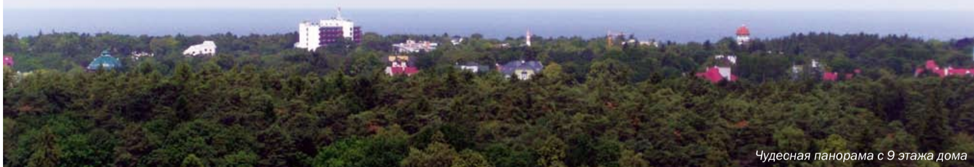
Чудесная панорама с 9 этажа дома

Сегодня компания Setl City Калининград ведет проектирование и строительство еще нескольких жилых комплексов в Калининграде и за его пределами. В их числе – третья очередь жилого комплекса на улице Шаманова в Пионерском, жилой комплекс «Южный парк» на улице Судостроительной в Калининграде. В перспективе рассматривается запуск нескольких новых жилых проектов в Светлогорске.